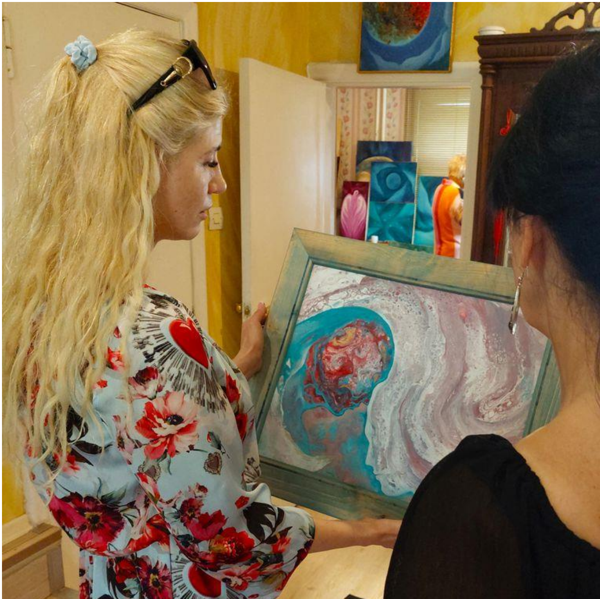
Rahulolev külaline just ostetud maaliga.

ka välismaale saatnud. Tean, et keegi kinkis ühe mu maali lastehaiglale. Ise olen kinkinud Tartu lastekodule. Iru hooldekodus on samuti mitmeid mu maale. See inimene, kes need sinna viis, tundis, et mu maalid annavad toetust sealsetele elanikele. Ka teraapiatubadesse on maale viidud,» räägib Kalamees.