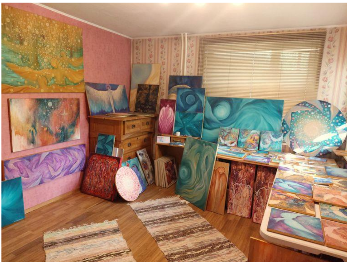
Toatäis maale.

Kalamees räägib, et juba lapsena meeldis talle maalida. «Ma pole õppinud kunstnik. Tunne ja soov maalida oli nii tugev. Õlimaale hakkasin tegema 2007. aastal,» ütleb ta.