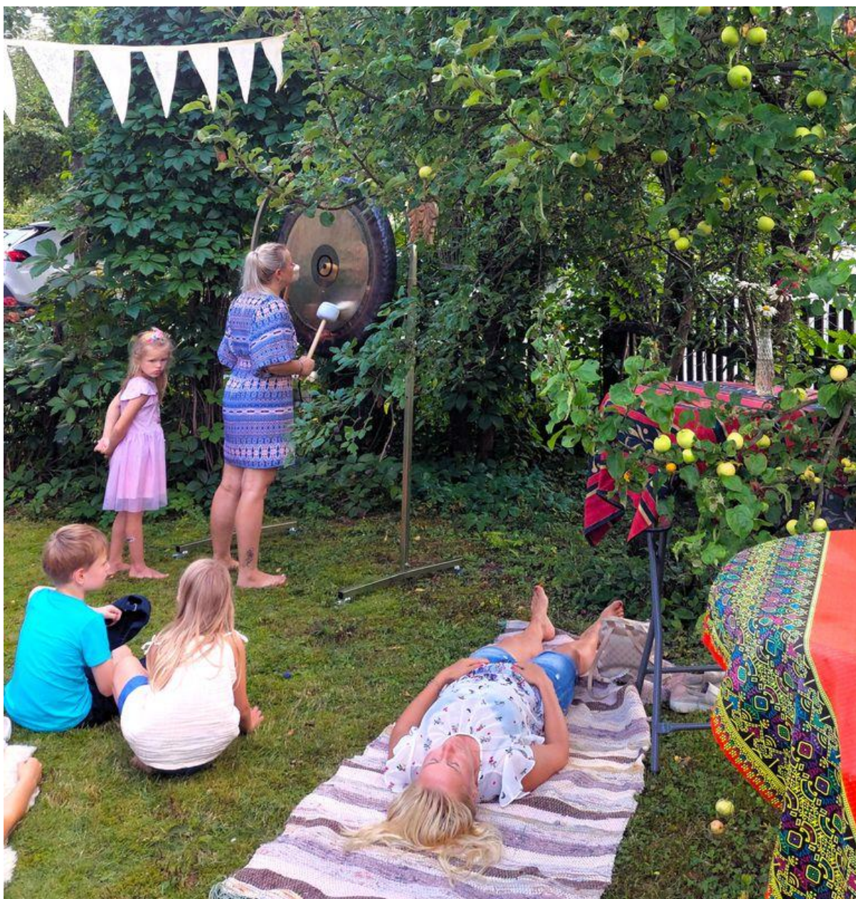
Gongimäng kohvikutepäeval.

Lastele pakkusid palju rõõmu kaks jänkut, kes olid uhke aediku sees ning kellel oli isegi oma voodi.