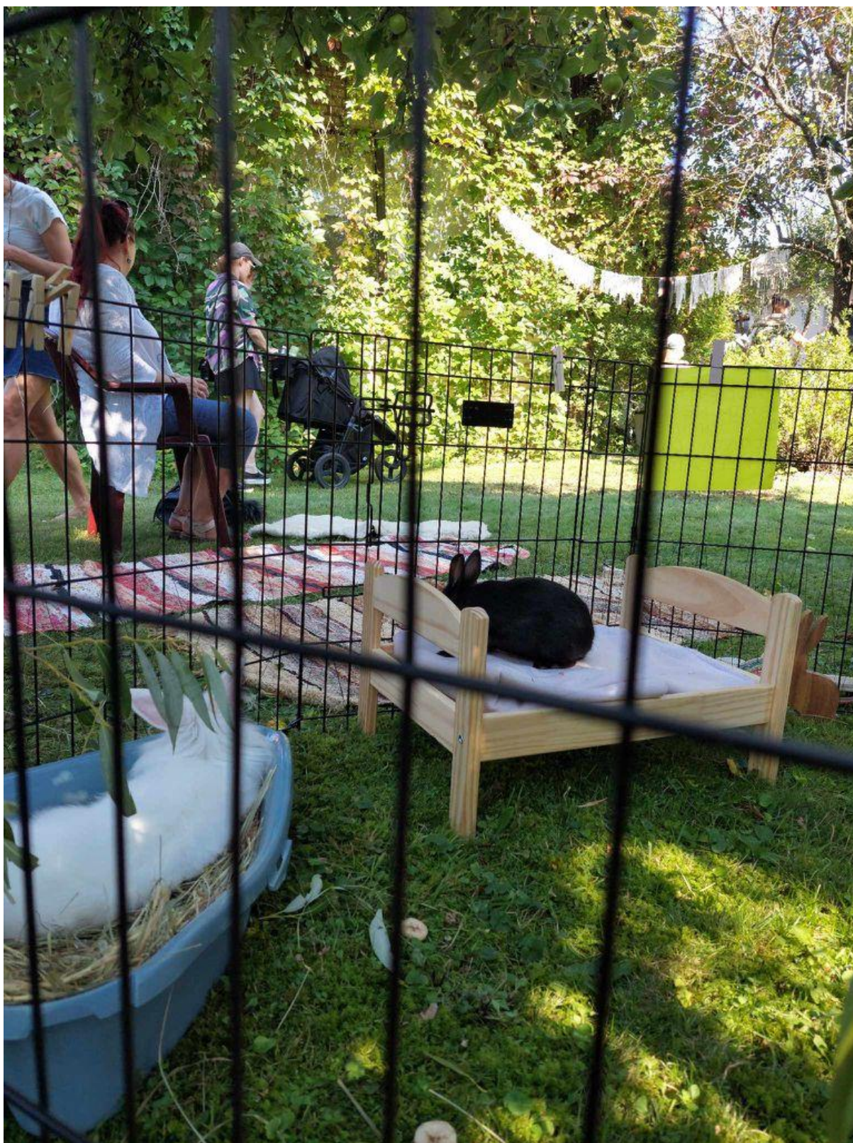
Lastel oli loomadest palju rõõmu.