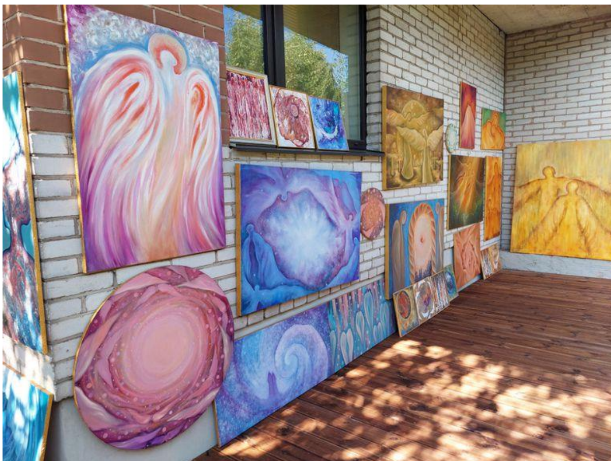
Terrass maalidega.