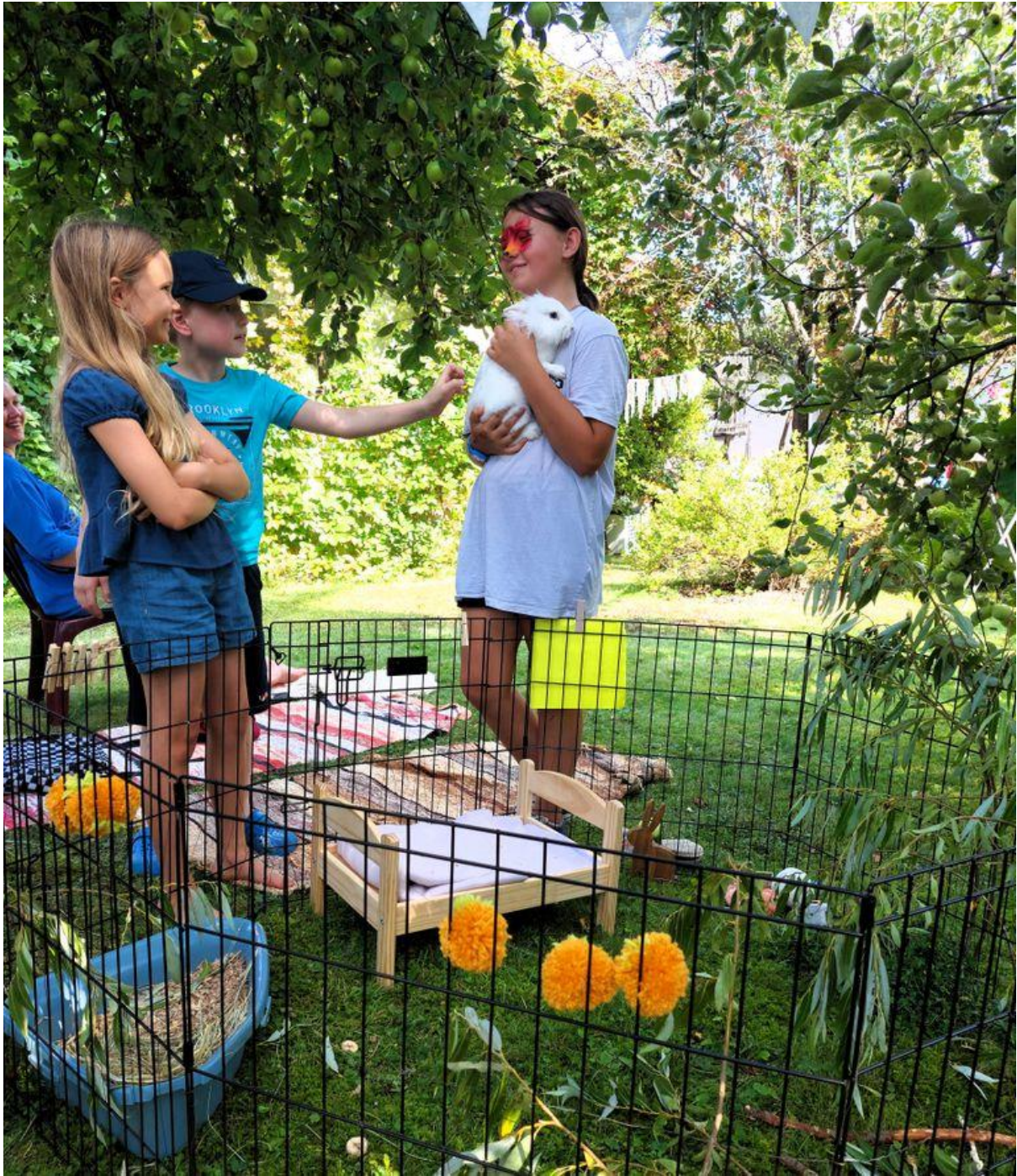
Kohvikutepäev Tammelinnas.